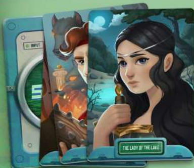
42 КАРТИ ФАНТОМІВ ВИГАДАНИХ ПЕРСОНАЖІВ