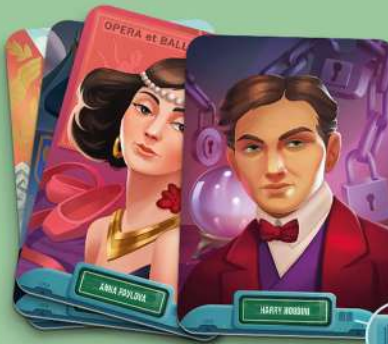
42 КАРТИ ФАНТОМІВ ІСТОРИЧНИХ ПЕРСОНАЖІВ