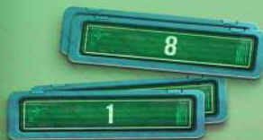
10 МАРКЕРІВ ФАНТОМІВ